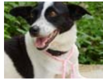
Problema vive ahora en Los Angeles

Rescatamos además a 9 perros y un gato que ingresaron a nuestro programa de adopciones.