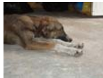
Gotita viajará pronto a Canadá