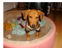
Río también será adoptado en la ciudad de México