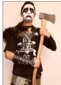
Aquí expone las armas (una casera y una hacha) para el desollamiento de los animales.

En las imágenes inferiores, muestra su afición por el anticristo, característica del satanismo: